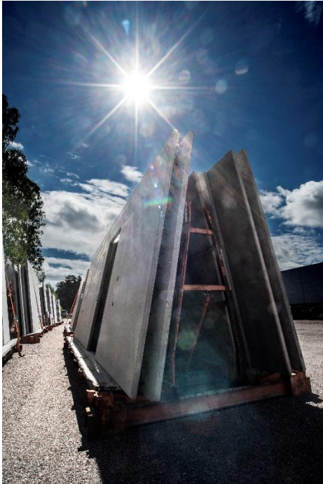
Figur 1 Skalvägg