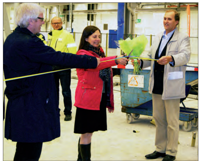
Som seden är, klippes formellt ett band för att inviga produktionen i fabriken.