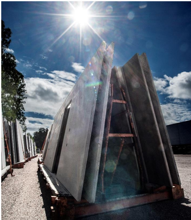
Figur 1 Skalvägg ECO 50