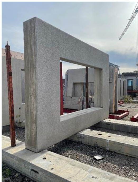
Figur 1 Sandwich Typ D