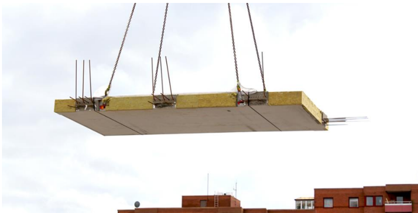
Figur 1 Balkongplatta